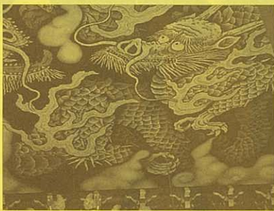
建仁寺法堂天井双龍図

建仁寺に行きましたが私は二度目なのですが、随分忘れてます。法堂の天井画の双龍図はとても立派ですが平成十四年に創建八百年を記念に描