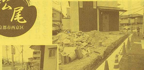
外構工事中です。 既存のブロックを 撤去しました。