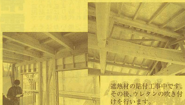
遮熱材の貼付工事中です。 その後、ウレタンの吹き付けを行います。