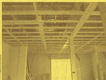
サイディング工事が 進んでいます