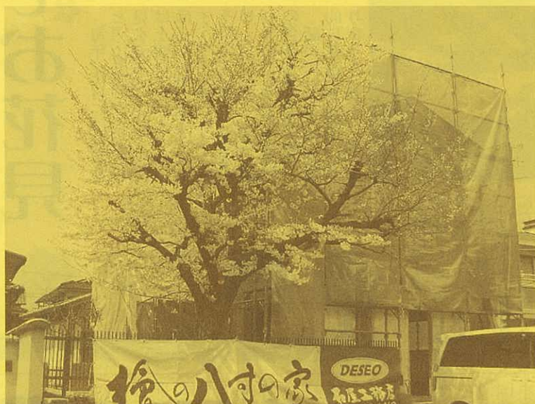
桜が満開の桂の現場(4/9撮影) 来年からは自宅でお花見ができるうらやましいお家です。

紙面では伝えきれないこだわりがたくさんあります。 ご予約いただければゆっくり詳しくご説明いたします。