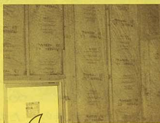
隅々までしっかり断熱材が入りました!!