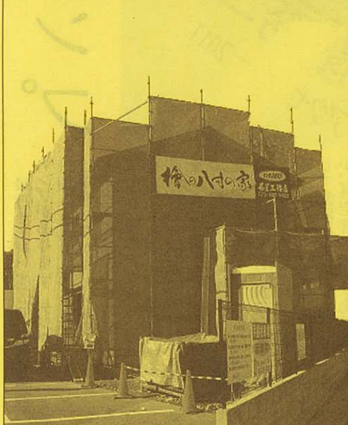
現況はこんな感じです。物集女街道から見えます。

檜の24cm角の柱です。ぜひ現地でご覧ください。 実際に見ると八寸の柱は迫力が違います。