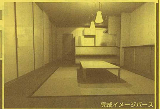
完成イメージパース

築不詳の帯屋さんを全面改装しました。 事務所は明るく使い勝手よく。 そして織機があったところを居住スペースに。 いわゆる「うなぎの寝床」の建物が、光を取り込み、 風が通り抜ける快適な空間に生まれかわりました。 他にも見どころがたくさんあるので、 ぜひ現地をご覧ください。