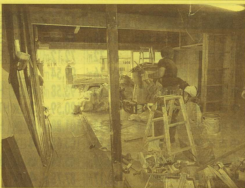
京町屋独特の細長い建物であり、お隣とも接してありますので光の取り込みや、風の抜けに知恵を働かせておられます。オープンハウスの承諾も得ましたので、完成時には皆様へお披露目させていただきます。