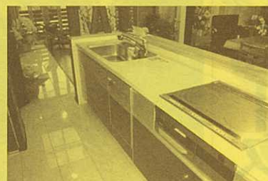
収納たっぷり、使い勝手の良いキッチンはお様の憧れですね。