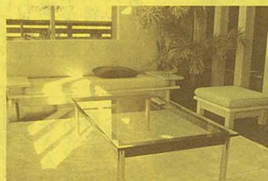
陽がさんさんと差し込む広いリビングは快適な空間です。