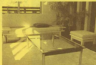
陽がさんさんと射し込む広いリビングは快適な空間です。