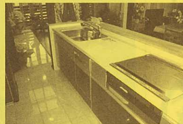
収納たっぷり、使い勝手の良いキッチンはお様の憧れですね。