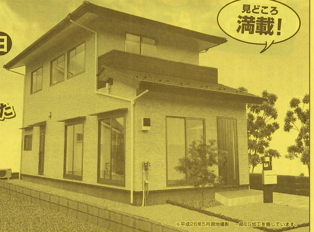
※平成26年5月現地撮影 一部CG加工を施しています。

2階のベランダから比叡山が一望できるK様邸。作業がしやすい様、水まわりの動線に考慮しました。食品庫やパソコンスペースもキッチンまわりに配置しています。2階の洋室は2室に仕切れる