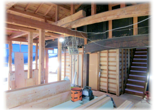
※丹後の工事状況です。