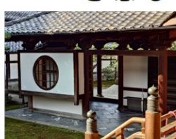
押し活で行った両足院

いろいろな業種の事務の仕事をしてきましたが建設不動産業界は初めてでした。経理や不動産の事務はコツコツ覚えることで慣れてきました。今書いているこの瓦版だけは毎回悩みの種でした。遊びに行ったりしてネタがあるときはまだいいのですが、ネタがないときは本当に困りました。それでも嬉しかったことは、来社されたお客様や電話で対応したお客様から『瓦版読んでますよ』と声をかけて頂いたり、以前にも書きましたが映画『RRR』について書いたときにはお礼のお手紙を頂いたりと、サンガの応援に行っているのを読んで一緒にいきたいと言ってくださり一緒に応援に行きたこととはとても良い思い出になりました。これも一つの経験として、また次の会社で押し活も楽しみます。ありがとうございました。