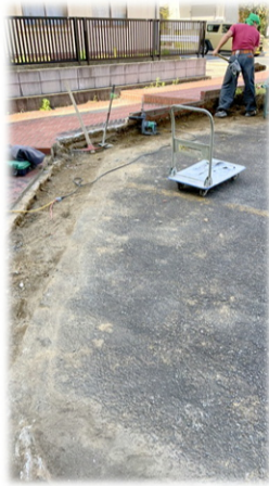
※鳴滝の物件の エントランス解体